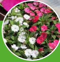
IMPATIENS Impatiens walleriana