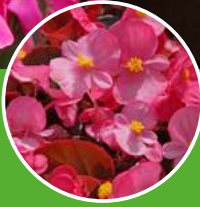
BEGONIA Begonia semperflorens

Grand classique de nos jardins, les Pétunia, Bégonias et Impatiens sont essentiels pour réaliser des massifs colorés, florifères et magnifiques tout l'été. Des apports réguliers d'engrais garantiront une abondance de floraisons.